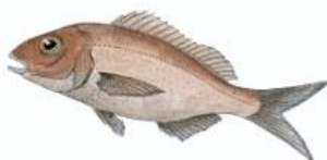
Pageot acarné 17 cm ( Pagellus acarne )