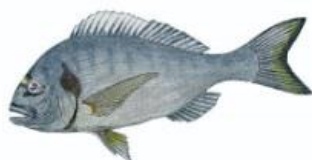
Daurade royale 23 cm ( Sparus aurata )