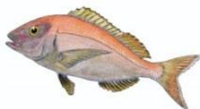
Pageot commun 15 cm ( Pagellus erythrinus )