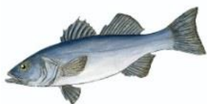
Loup (Bar commun) 30 cm ( Dicentrarchus labrax )