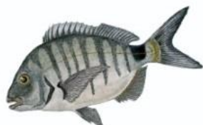
Sar commun 23 cm ( Diplodus sargus )