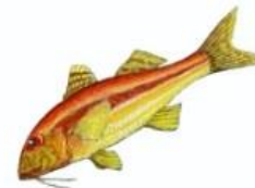
Rougets 15 cm ( Mullus sp. )