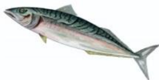
Maquereaux 18 cm ( Scomber sp. )