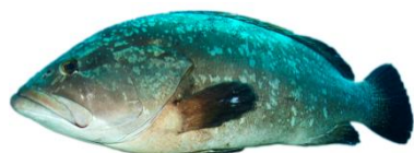
Mérou brun ( Epinephelus marginatus ) Fin moratoire 23/12/2023