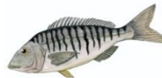
Marbré 20 cm ( Lithognathus mormyrus )