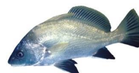
Corb ( Sciaena umbra ) Fin moratoire 23/12/2018