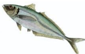
Chinchards 15 cm ( Trachurus sp. )